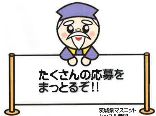
茨城県マスコット ハッスル黄門