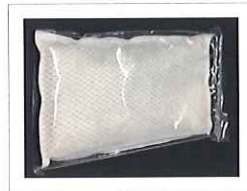
据え置き型・メッシュタイプ

臭いが気になる所の周囲に置き、 空気中の原因気体を吸着します。 芳香剤を含まないため、 香料等が苦手な方にも 安心してお使い頂けます。